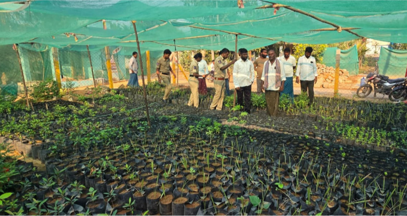
అనంతగిరి ఏప్రిల్ 19 మీడియా టుడే:-

పాలవరం: నర్సరీని పరిశీలించిన ఎక్సైజ్ ఎస్సై