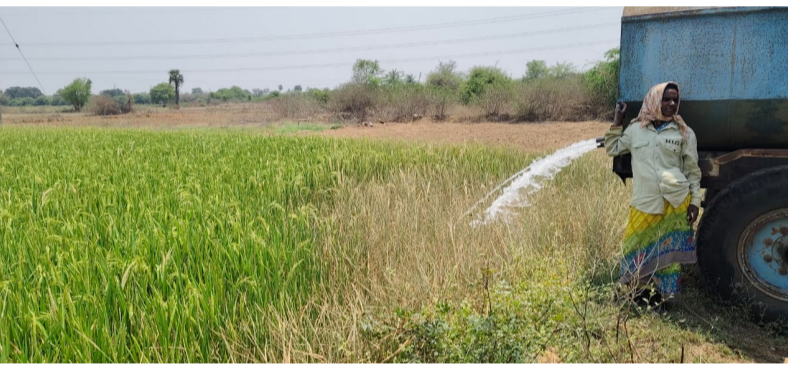
యాచారం, మార్చి 19 (మీడియా టుడే)

బోరుబావులపై ఆధారపడి వరి సాగు చేసే రైతుల పరిస్థితి అగమ్యగోచరం