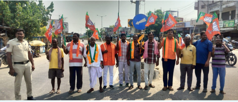
( మీడియా టుడే గరిడేపల్లి ఏప్రిల్ 19)