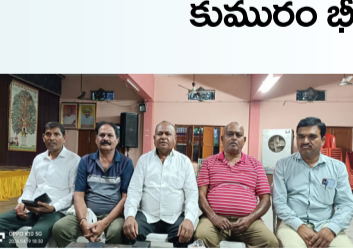
కుమరం భీం ఆసిఫాబాద్, మీడియా టుడే ప్రతినిధి కాగజ్ నగర్, ఏప్రిల్ 19: కుమరం భీం ఆసిఫాబాద్ జిల్లా కాగజ్ నగర్ పట్టణంలోని ఎల్ల గౌడ్ తోటలో గల పద్మశాలి కమ్యూనిటీ హాలులో ఆదివారం నూతనంగా ఎన్నుకోబడిన