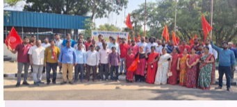
ఉప్పల్, మే 01 (మీడియా టుడే ప్రతినిధి):