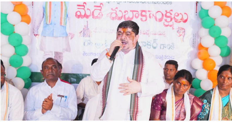
చిగురుమామిడి మండల డిప్యూటీ కమిషనర్ : మీడియా టుడే , మే 01 : కరీంనగర్ జిల్లా హుస్సాబాద్ ఆర్డీసీ కార్యాలయంలో కలిసి మే డే వేడుకలు

ముఖ్య అతిథిగా హాజరైన మంత్రి పాన్నం ప్రభాకర్