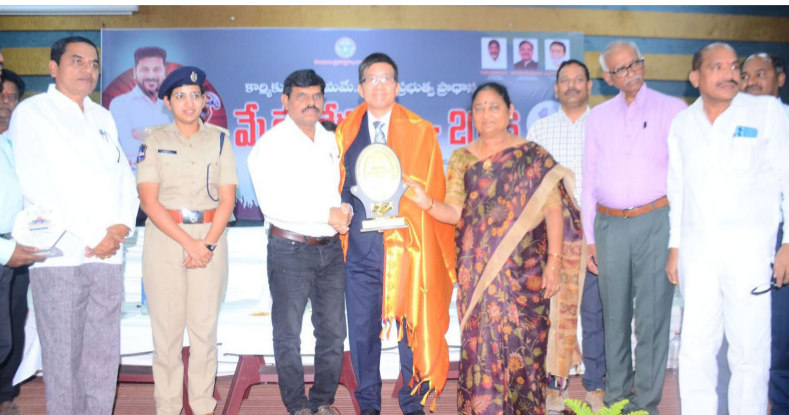
సంగారెడ్డి జిల్లా, మీడియా టుడే, మే 1.