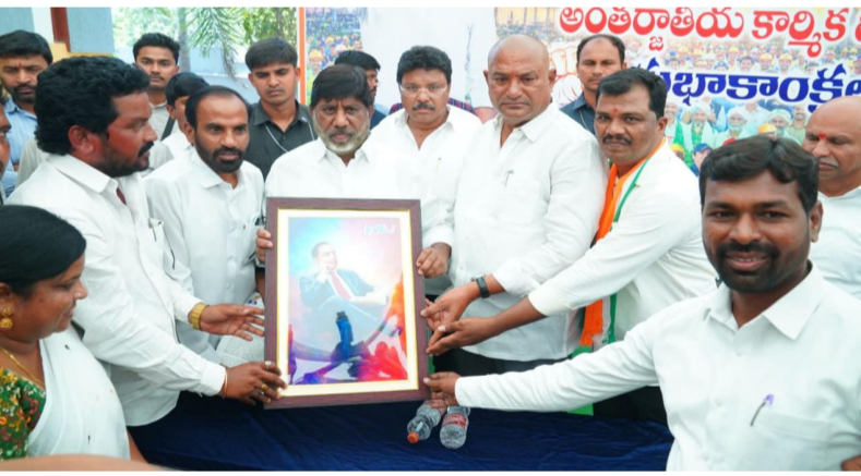
మిర్యాలగూడ, మే 1 (మీడియా టుడే): అంతర్జాతీయ కార్మిక దినోత్సవం సందర్భంగా శుక్రవారం నల్గొండ జిల్లా