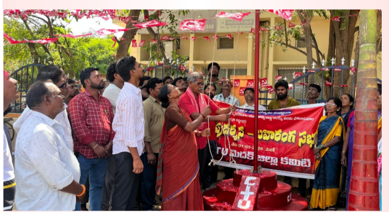
మెదక్ జిల్లా (మీడియా టుడే) మే 1